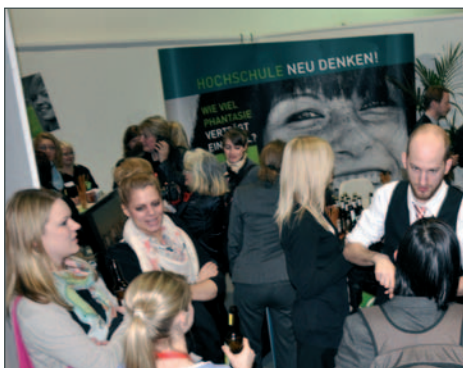
Der Empfang war Treffpunkt für Studierende, Alumni, Mitarbeiter und Partner.