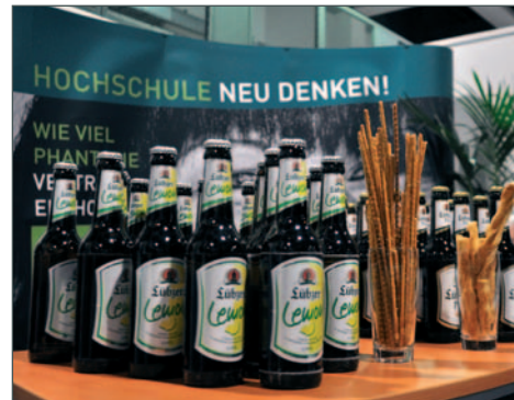
Die Mecklenburgische Brauerei Lübz und Güstrower Schlossquell unterstützten das BC.