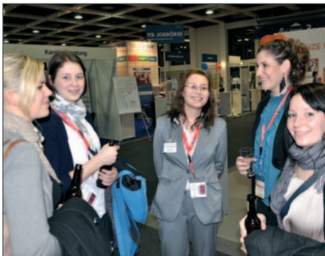
Studierende genossen den Plausch nach Ihren Aufgaben als Messehostessen auf der ITB.

Nach Hause kommen - getreu dem Motto des Getränkepartners „Lübzer“ trafen sich am Stand der Hochschule viele (ehemalige) Weggefährten zum Wiedersehen und Kontakte knüpfen. „Für die Fortentwicklung des Baltic College sind Treffen dieser Art sehr wichtig“, machte Präsident Jens Engelke deutlich, „der Empfang auf der ITB war eine gute Gelegenheit, bei einem Bier oder einer Schorle Projekte zu konkretisieren. Der Empfang war vor allem auch eine gemeinsame Plattform für Studierende und Unternehmer.“ [mbo]