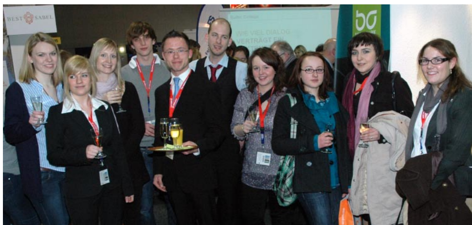
Fleißig bei der Standbetreuung: Studierende und Absolventen des Baltic College.

Täglich präsentierten Lehrende und Studierende des Baltic College ihre Hochschule, standen Interessierten Rede und Antwort und erweiterten das Netz von Kooperationspartnern. Der Erfolg des BC-Messestandes ist deutlich. Und bei der ITB 2010 wird das Baltic College noch für einen noch höheren Wert auf der touristischen Richterskala sorgen.